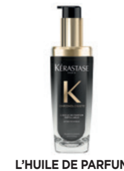
L'HUILE DE PARFUM