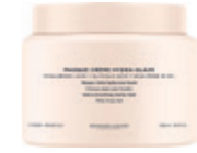
MASQUE CRÈME HYDRA-GLAZE Para cabello muy encrespado