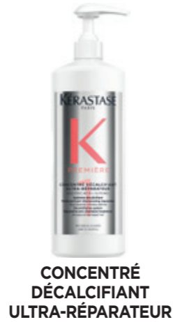
CONCENTRÉ DÉCALCIFIANTE ULTRA-RÉPARATEUR