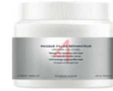
MASQUE FILLER RÉPARATEUR