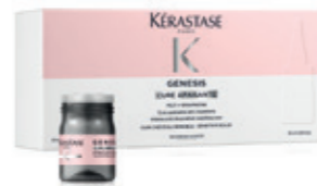
CURES ANTI-CHUTE FORTIFIANTES