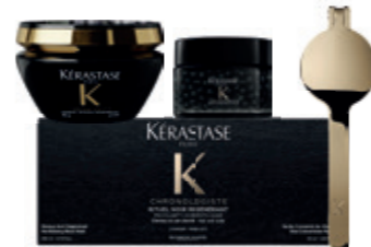
RITUEL NOIR RÉGÉNÉRANT