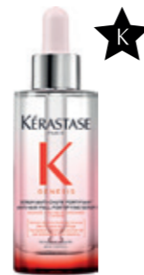
SERUM ANTI-CHUTE FORTIFIANT