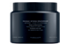
MASQUE INTENSE RÉGÉNÉRANT