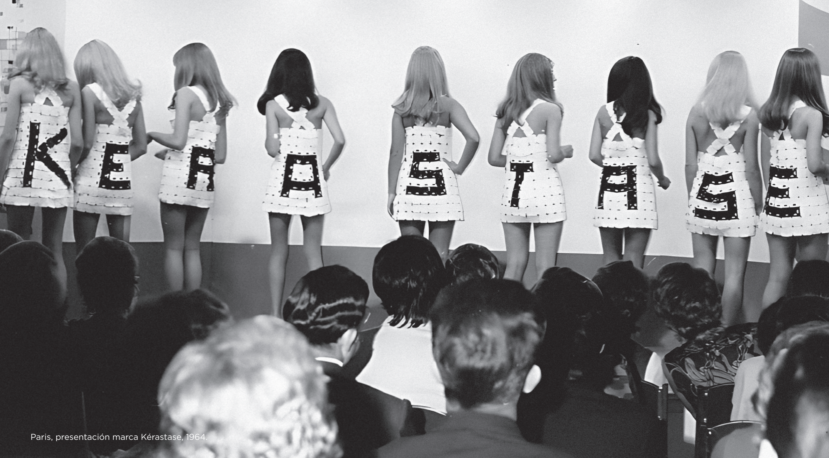
Paris, presentación marca Kérastase, 1964.