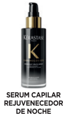
SERUM CAPILAR REJUVENECADOR DE NOCHE