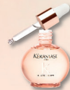
GLAZE DROPS Huile légère haute brillance