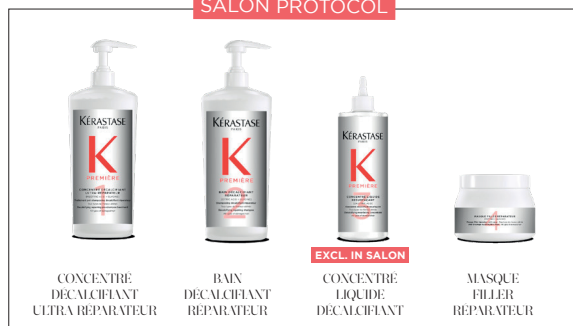
CONCENTRÉ DÉCALCIFANT ULTRA RÉPARATEUR