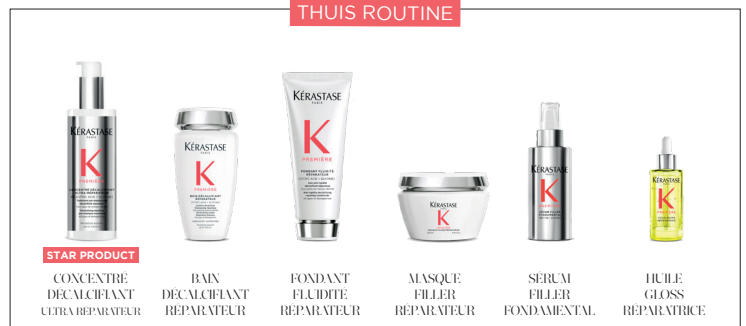
STAR PRODUCT CONCENTRÉ DÉCALCIFANT ULTRA RÉPARATEUR